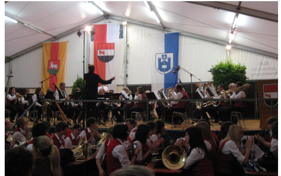
Die MGSTW am Dreiländerkonzert in Oberzell (D) 2011