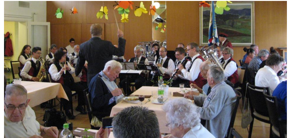
Konzert im Haus zur Heimat in Olten vom 27. April 2014